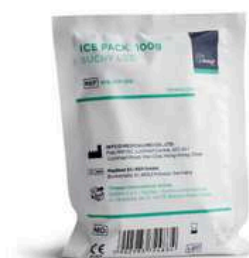
Okłady chłodzące dla klientów