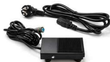
Stopka do aktywacji impulsu i kabel zasilający