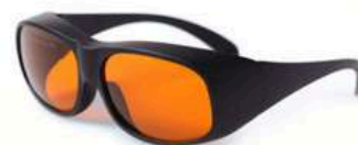
Okulary ochronne w standardzie OD5+