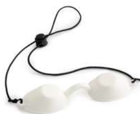
Okulary ochronne dla klienta