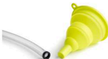
Lejek z sitkiem blokującym zanieczyszczenia